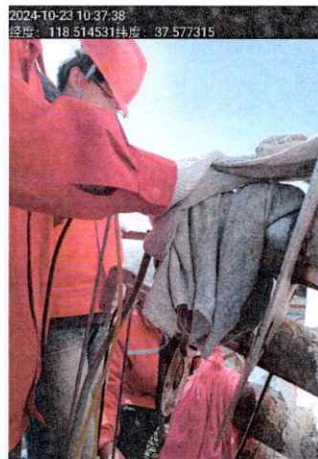
图 2 现场采样照片