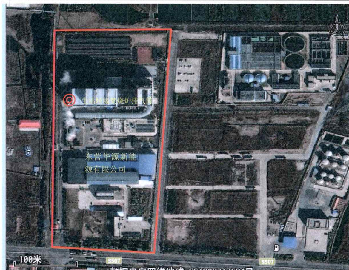
有组织废气检测点