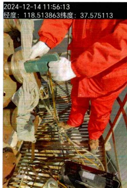
图 2 现场采样照片