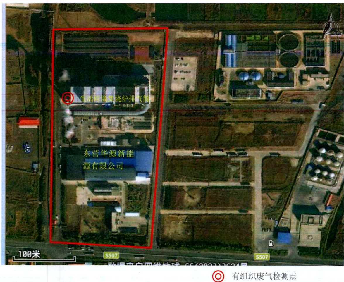
图 1 有组织废气检测点位示意图